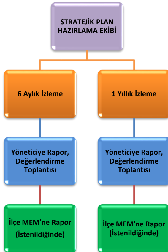
Şekil 10: İzleme ve Değerlendirme Süreci

Müdürlüğümüzün 2019-2023 Stratejik Planı İzleme ve Değerlendirme sürecini ifade eden İzleme ve Değerlendirme Modeli hazırlanmıştır. Müdürlüğümüzün Stratejik Plan İzleme-Değerlendirme çalışmaları eğitim-öğretim yılı çalışma takvimi de dikkate alınarak 6 aylık ve 1 yıllık sürelerde gerçekleştirilecektir. 6 aylık sürelerde Üst Yöneticiye rapor hazırlanacak ve değerlendirme toplantısı düzenlenecektir. İzleme-değerlendirme raporu, istenildiğinde Stratejik Geliştirme Başkanlığına gönderilecektir. Ayrıca ilimizin Mülki İdari Amirine sunulacaktır. 1 yıllık izleme-değerlendirme çalışmaları, Stratejik Planımızda yer alan hedeflerin yıllık düzeyde ifade edildiği Performans Programı ve yılsonunda gerçekleşme düzeylerinin belirlendiği Faaliyet Raporu hazırlanarak yapılacaktır. Performans Programı ve Faaliyet Raporu Üst Yöneticinin değerlendirmesinin akabinde Strateji Geliştirme Başkanlığına ve Mülki İdari Amire sunulacaktır. Yıllık izlemelerle ilgili değerlendirme toplantıları düzenlenecektir.